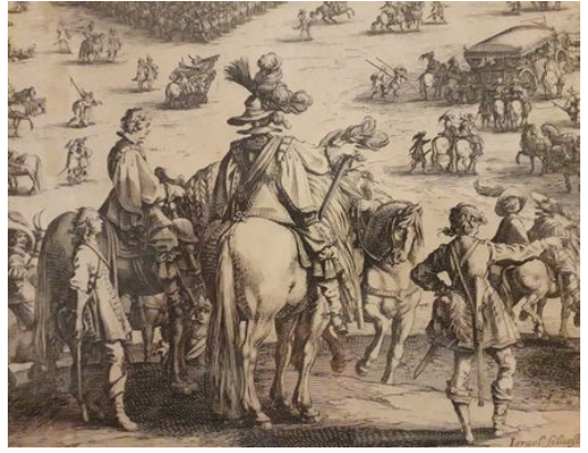
Links te paard: Isabella van Spanje - Rechts te paard: Ambrogio Spinola

Breda zou tot 1637 in Spaanse handen blijven. De inname van de stad was echter wel de laatste overwinning van de Spaanse troepen.