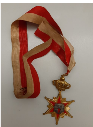
Insigne Bonus Eventus

In 1868 verschijnt het oudste Bredase carnavalskrantje (de Kontlopper avant la lettre) en vindt er een kleine optocht plaats. In 1882 wordt de Bredase Carnavals Club opgericht. Twaalf jaar later wordt de ontspanningsvereniging Bonus Eventus opgericht. Zij organiseert een optocht en een veelal besloten carnavalsfeest. Van een prins Carnaval was nog geen sprake. Bonus Eventus (koninklijk erkend, dat dan weer wel!) hield zich overigens tot 1955 ook met andere activiteiten bezig, zoals Oud Breda in de jaren '10 van de vorige eeuw, het geven van toneel- en andere uitvoeringen en medewerking verlenen aan liefdadigheidswerken.